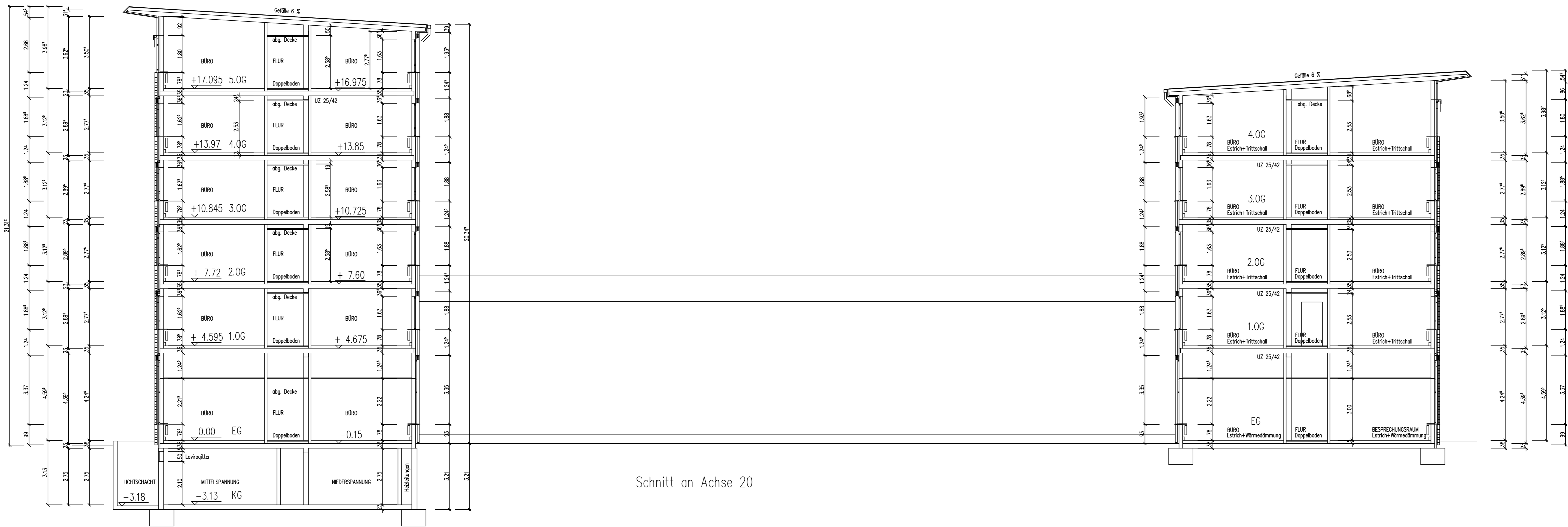
Schnitt an Achse 20